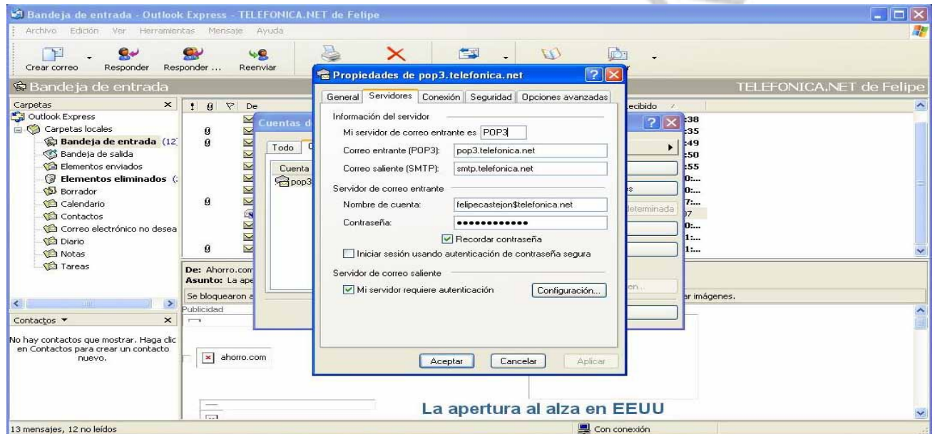
La apertura al alza en EEUU