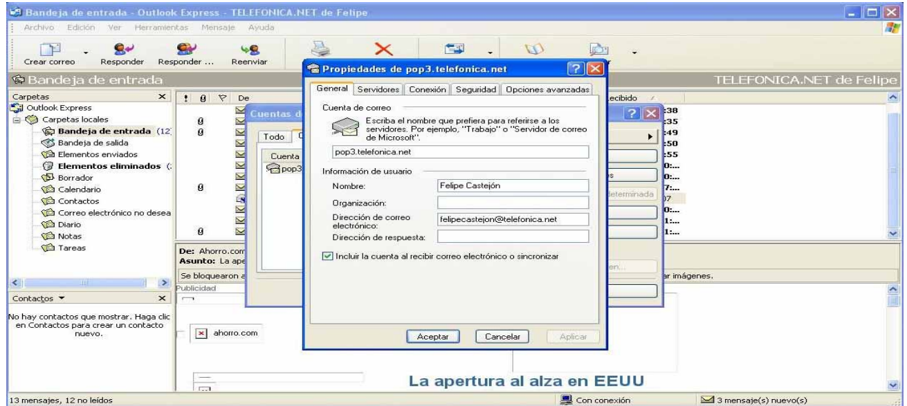
La apertura al alza en EEUU